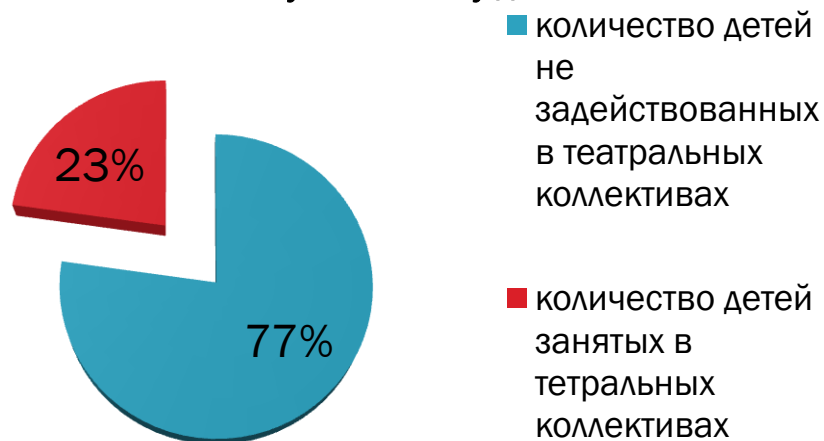
Соотношение участников любительских театров к общему количеству детей

Кукольный театр «Капитошка» и театр юного зрителя «Забава» на сегодняшний день – это один из признанных вариантов театрального самовыражения для детей в Клименковском ЦКР. Проблема в недостатке социальной адаптации детей с ограниченными возможностями здоровья посредством участия их в театральных постановках.